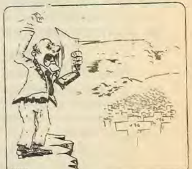
Στίχοι της «Χαρωνίς» της Αντίρας 28/1 για το μνημόσυνο. Αυτό που δεν είναι η «Χαρωνίς» είναι η δικαιολόγηση της θέσης (που προβάλεται στην πρώτη σελίδα της ίδιας έκδοσης) για ενότητα με τον Συναγερμό (αυτο στην οποία σημαίνει η κυβέρνηση Εθνικής Ενότητας), με το κόμμα δήλαδή που οργάνωσε το μνημόσυνο το κόμμα που ανεγείρει τες δολοφονίες.

Αυτή η πολιτική της εθνικής ενότητας απογοητεύει και αποπροσανατολίζει την εργατική τάξη. Αντίθετα μια πολιτική ενότητας της αριστερας θα ενθουσιάζει και θα βοηθήσει την εργατική τάξη να απομονώσει ηγεσίες σαν κι αυτές του Συναγερμού.